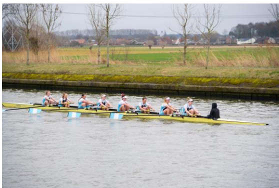
Onze damesacht op de Brugge Boat Race

Sport Gent nam deel met drie achten. De beste uitslag was er voor de juniorheren met een tweede plaats, zeer nipt na Gravelines. De seniorheren werden zevende op twaalf, de seniordames vierde op vijf startende ploegen.